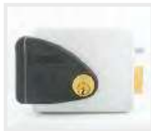
Lock 15 Ηλεκτρική Κλειδαριά Electric lock