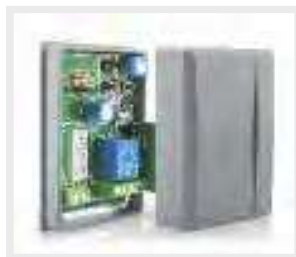
33RS Εξωτερικός δέκτης External receiver