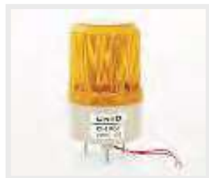
FA-15 Εξωτερικός φάρος Blinker light