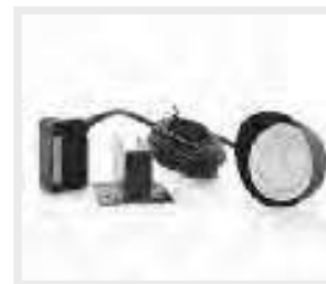
IR-1000 Φωτοκύτταρο με ανακλαστήρα Retro reflective photocell